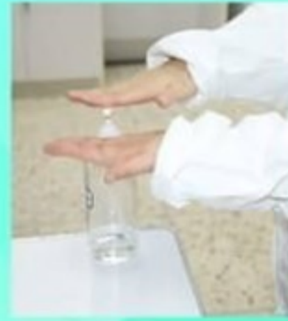
6. ถูมือด้วย alcohol gel