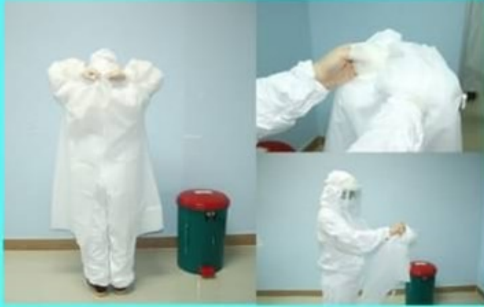
2. ถอดกาวกันน้ำ พร้อมถุงมือ

1. ถอดถุงมือชั้นแรก ในห้องผู้ป่วย เดินออกจากห้องผู้ป่วยมาตามทางเดินเส้นทางสีแดงเข้าห้องถอด PPE โชนสกปรก