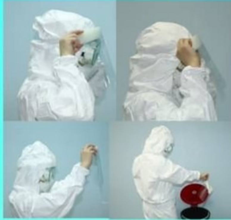
3. face shield