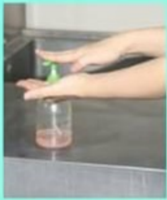
8. ถูมือด้วย alcohol gel