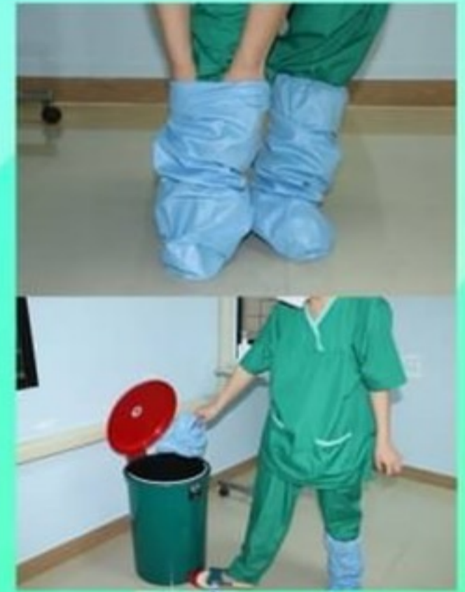
7. ถอด leg cover สวมรองเท้าแตะที่เตรียมไว้ ข้ามมาโซนสะอาด