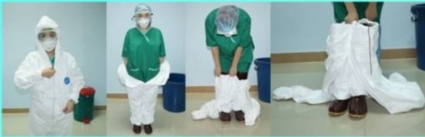
5. cover all พร้อมรองเท้าบูทโดย ดึงชุด cover all ให้คลุมรองเท้าบูท