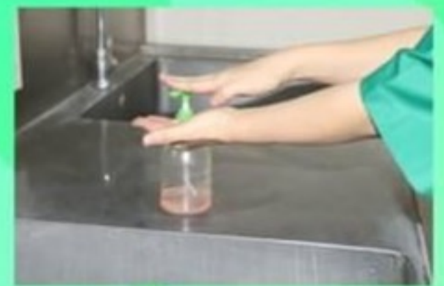
10. ถูมือด้วย alcohol gel