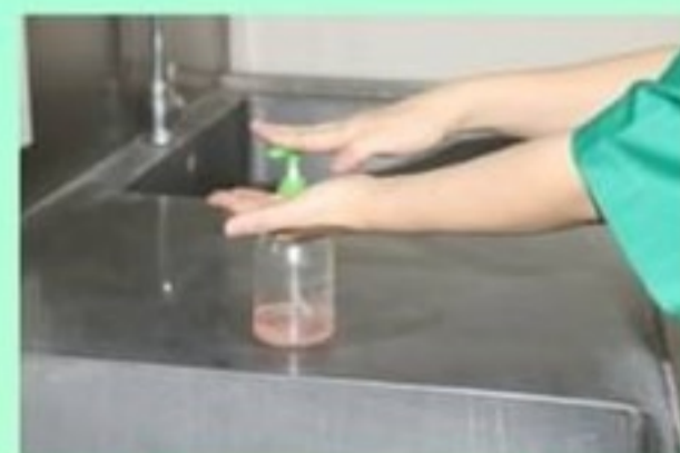
12. ถูมือด้วย alcohol gel