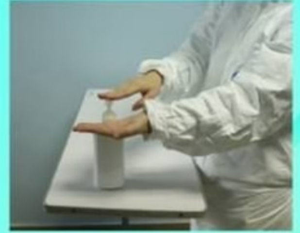
4. ถูมือด้วย alcohol gel