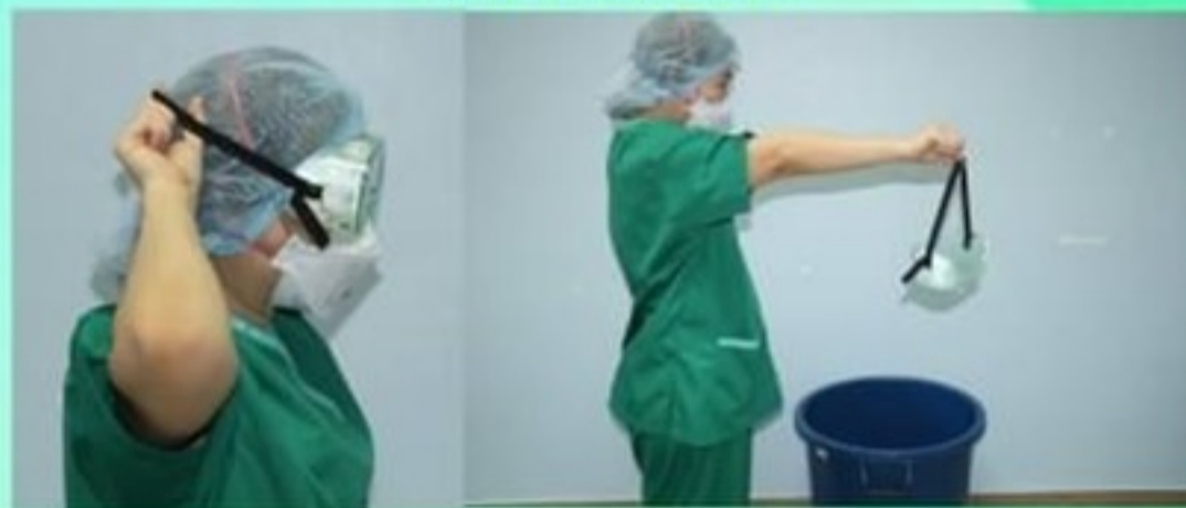
9. ถอดแว่นตา