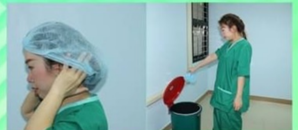
13. ถอดหมวกคลุมผม