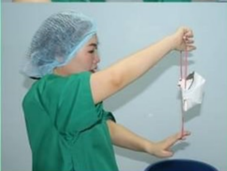
11. ถอด N95